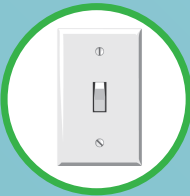
สวิตช์ไฟ