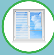
มุ้งลวด/มู่ลี่