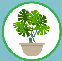
ต้นไม้ในบ้าน