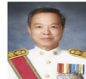
นพ.สุรเดช วลีอิทธิกุล เลขาธิการสำนักงานประกันสังคม