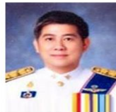
นพ.เจษฎา โชคดำรงสุข อธิบดีกรมควบคุมโรค