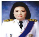
หม่อมหลวง ปองทริก สมิติ ปลัดกระทรวงแรงงาน