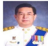
นายสุเมธ มโหสถ อธิบดีกรมสวัสดิการและคุ้มครองแรงงาน